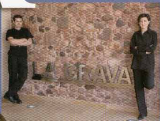
El Morell (Tarragona) LA GRAVA