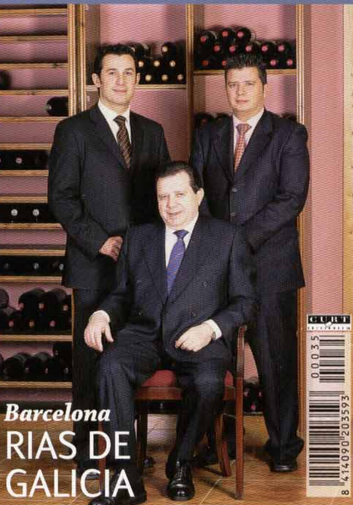
Barcelona RIAS DE GALICIA