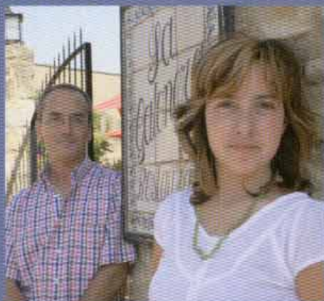
Pals (Girona) SA GATONERA